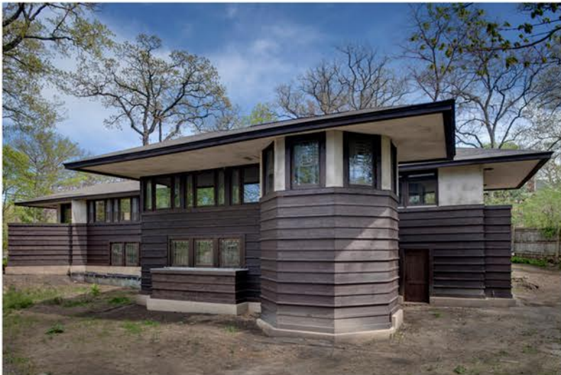
CASA GLASNER (FRANK LLOYD, 1905)