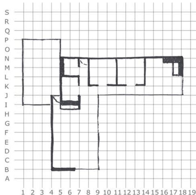
TIPOLOGÍA CASA USONIANA, FORMA L