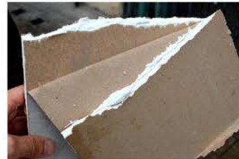
Carpinterías interiores de cartón yeso