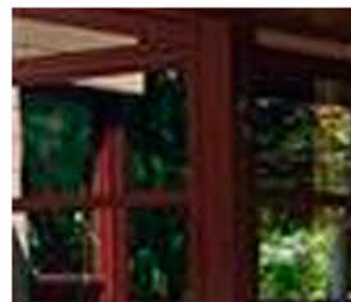
Láminas de vidrio para los ventales de fachada (y ventanas)