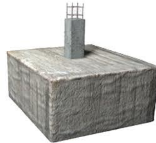
Cimentación de hormigón armado