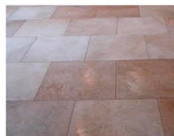
Gres cerámico para interior y exterior