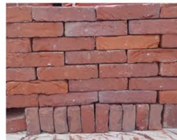
Ladrillo caravista para muros exteriores y tabiques interiores