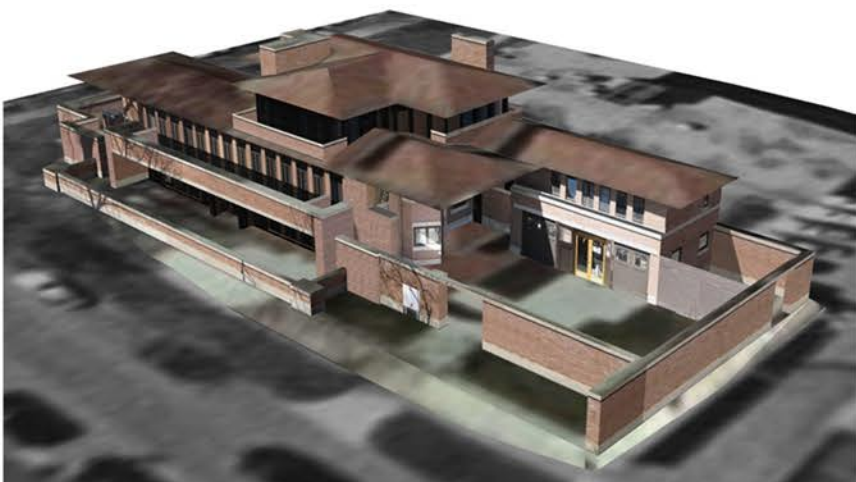
CASA ROBIE (FRANK LLOYD, 1910)